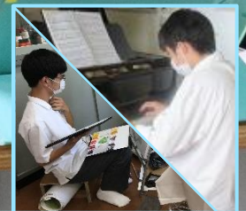
専攻授業の雰囲気わかる！